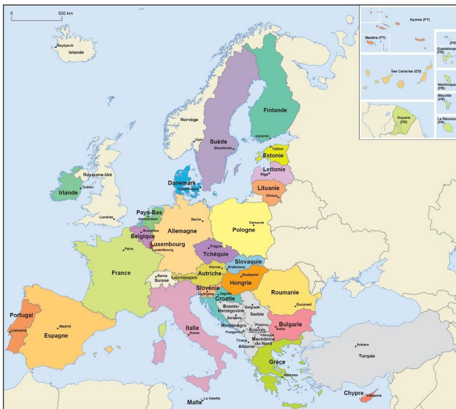
États membres de l'Union européenne (2020) Pays candidats et pays candidats potentiels