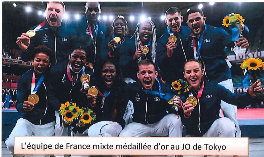
L'équipe de France mixte médaillée d'or au JO de Tokyo

Tous les renseignements du club sont disponibles sur la page Facebook JUDO PASSION BRIENNON ou contacter M. Joris DEHAVNNE au 06/89/03/07/64 ou M. Jérôme SENECHAL au 07-61-37-59-45