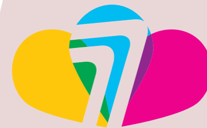
SCHÉMA DES SOLIDARITÉS PROTÉGER, ACCOMPAGNER RENDRE AUTONOME

Direction générale adjointe de la solidarité Hôtel du Département | CS 50377 | 77010 Melun cedex 01 64 14 77 77 | seine-et-marne.fr