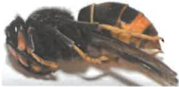
Gyne FA en dormance pendant la phase hivernale