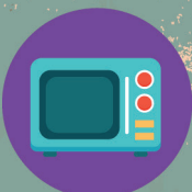
PETIT ELECTRO MÉNAGER