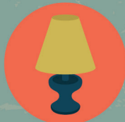
BIBELOT - DÉCO LUMINAIRE