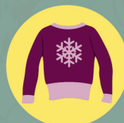
VÊTEMENT LINGE DE MAISON CHAUSSURES MAROQUINERIE