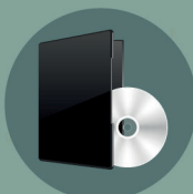
CD - DVD JEU VIDÉO