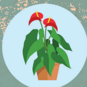
PLANTE ET GRAINES