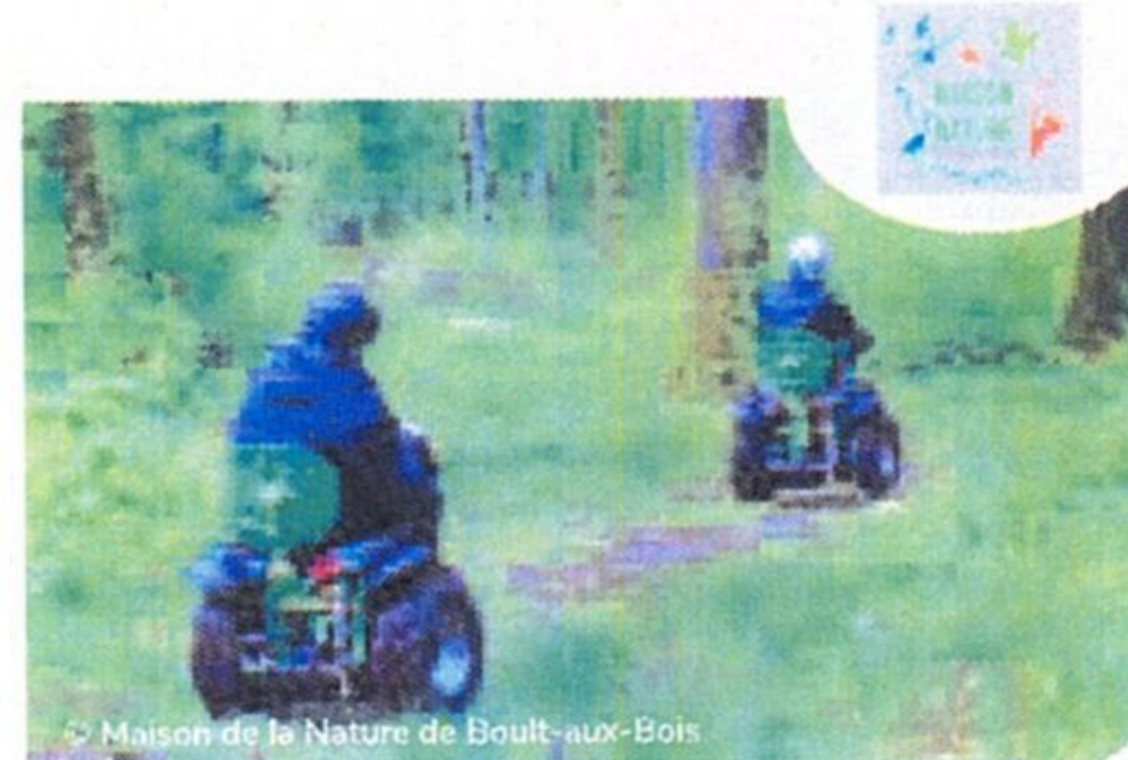
↳ Maison de la Nature de Boult-aux-Bois

Vous longerez la rivière et observerez la diversité des prairies humides et du bocage.