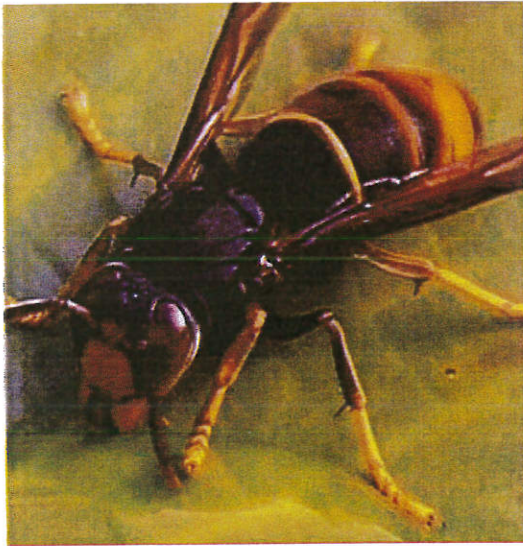
Pattes jaunes = frelon asiatique

lobrusc48@gmail.com , au 06.82.41.21.15, sur notre page Facebook Rucher-école Lo Brusc d'Olt, ou encore dans notre boîte aux lettres à la Mairie de Banassac.