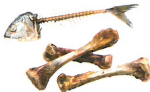
Déchets alimentaires non compostables