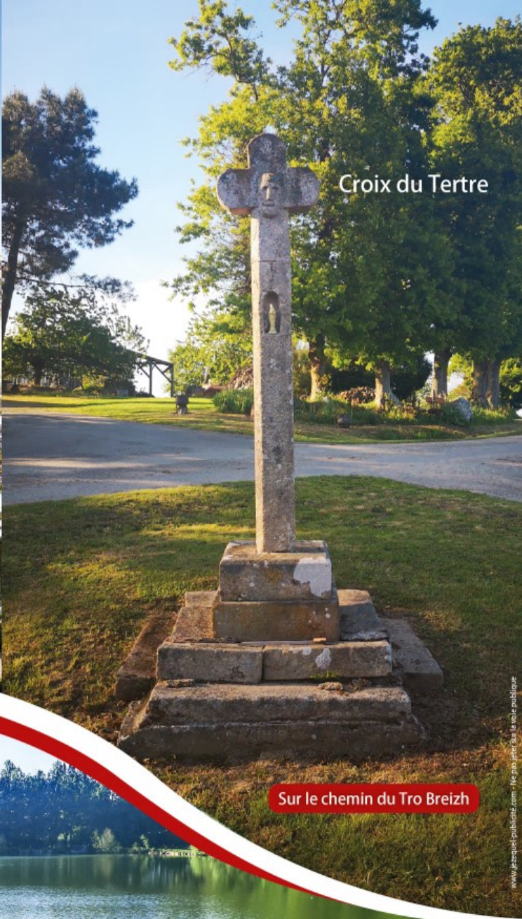
Sur le chemin du Tro Breizh

www.gestequepublique.com - le plus près au site public