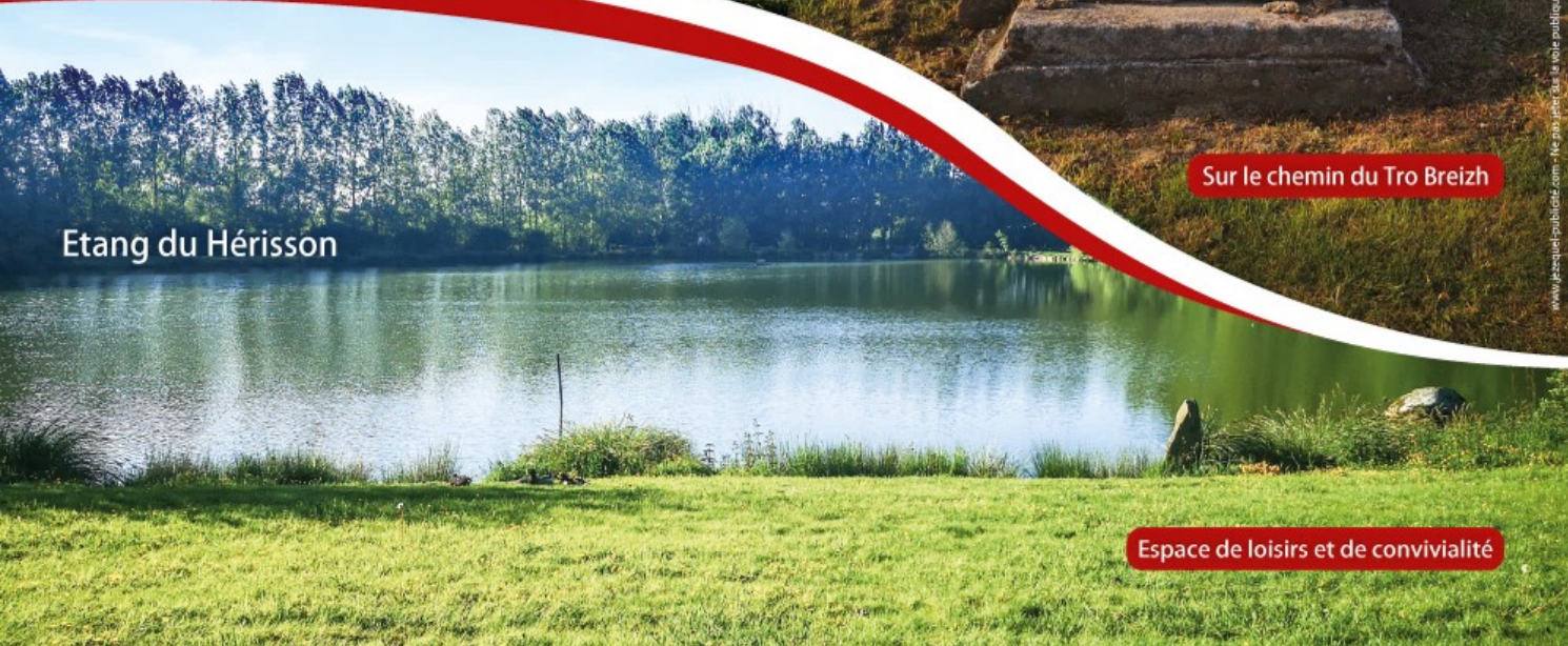
Espace de loisirs et de convivialité