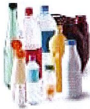
Bouteilles, bidons et flacons en plastique