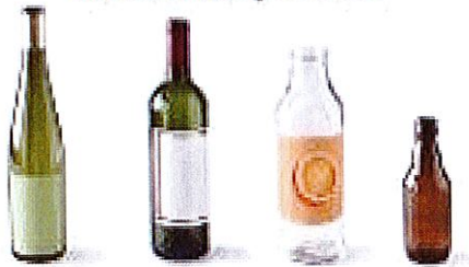
Bouteilles, canettes et bocaux