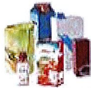
Briques alimentaires, sacs et films, emballages métalliques