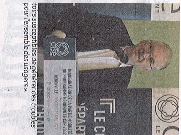
tours susceptibles de générer des troubles pour l'ensemble des usagers ».

Lors de son discours prononcé à l'occasion de l'inauguration des travaux qui marquent la fin de la première phase du projet « Hénonville Cap 2032 », le maire a expliqué qu'il avait priorisé la sécurité des déplacements dans le village en se fixant trois axes. « Apaiser la circulation des véhicules en incitant les automobilistes à lever le pied; fluidifier le trafic en proposant un plan de circulation afin d'éliminer les problèmes d'engorgements aux heures de pointe; y compris dans les voies secondaires de la commune; Repenser et améliorer le stationnement afin de limiter les stationnements anarchiques sur les trot-