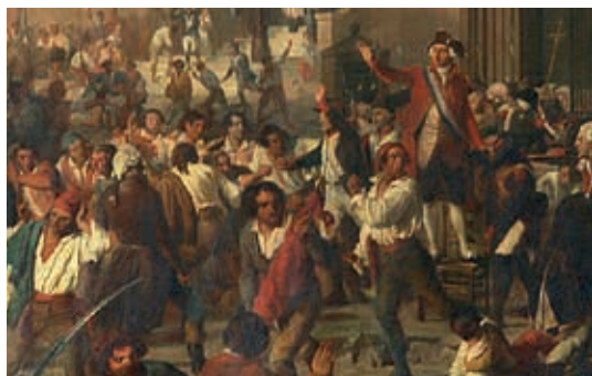
Jules Varnier, Rodolphe d'Aymard et la garde nationale d'Orange arrêtant les massacres d'Avignon, le 11 juin 1790 , huile sur toile, 1845