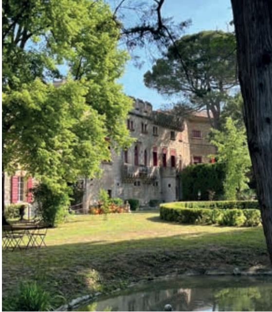
Le château de Thézan, à Saint-Didier, est labellisé Patrimoine en Vaucluse.