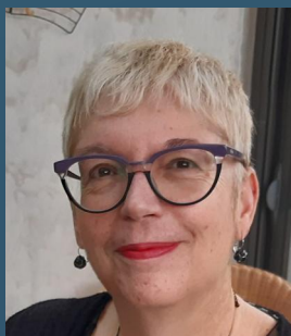
Le Maire du Bardonnay

En de telles circonstances, vigilance et entraide sont nécessaires et salvatrices.