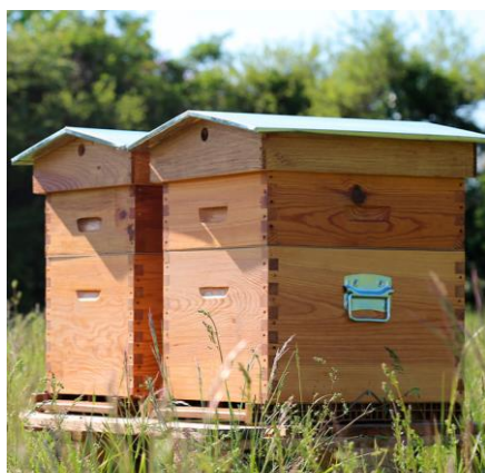
L'apprentissage de l'apiculture