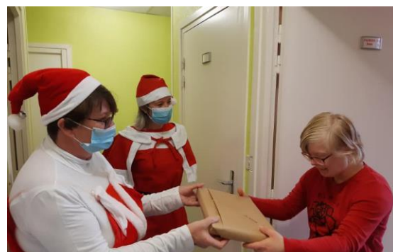
Un cadeau de Noël pour toutes les personnes restées en établissement pendant les fêtes de fin d'année