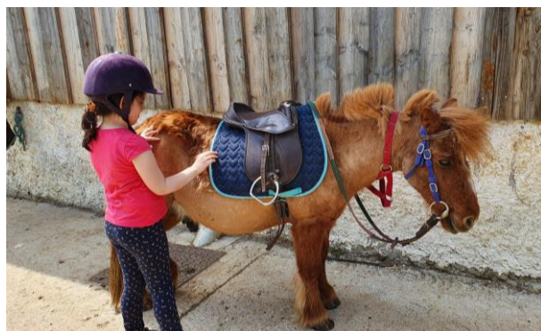
Des séances d'équithérapie pour un IME