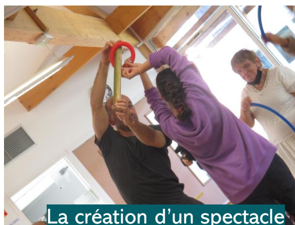
La création d'un spectacle de danse et musique

Mais aussi : l'achat de matériel sportif pour la reprise du sport adapté dans un IME, un séjour en gîte, l'aménagement des espaces extérieurs d'un foyer d'hébergement, un séjour en village vacances adapté pour les résidents d'une MAS, etc.