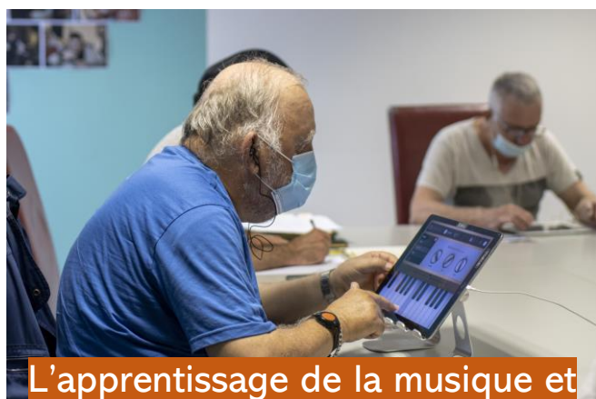
L'apprentissage de la musique et Montage d'un spectacle