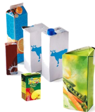
Les briques alimentaires