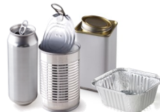
Les boîtes de conserve et barquettes en aluminium