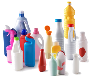
Les bouteilles et flacons en plastique « opaques »