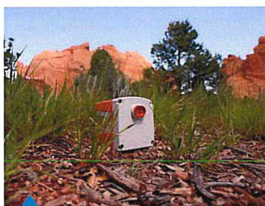
Géophone sans fil WING | Sercel

Après avoir obtenu les autorisations de passage nécessaires auprès des propriétaires, la campagne d'exploration commence, en ce début de mois, par des mesures topographiques, suivies de l'installation de géophones à intervalles réguliers.