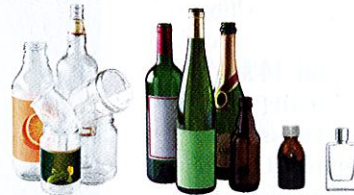
Tous les emballages en verre : bouteilles, pots, bocaux et flacons

Bien vidés, non lavés et sans couvercle pas d'ampoule, de néon, ni de vaisselle