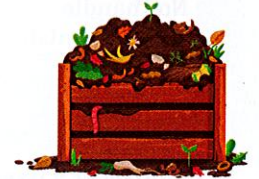
Composteur domestique en vente à prix réduit à l'agglomération (déchets biodégradables)