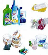
Emballages en plastique