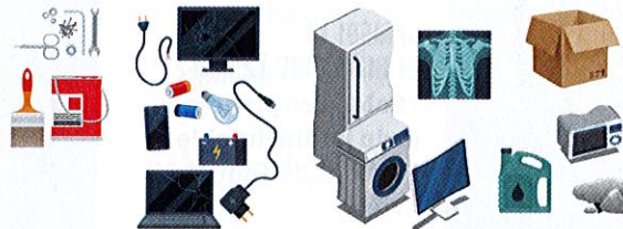
Déchets verts, cartons, objets et matériaux de la maison, bois, métaux, gravats, déchets enfouis, huiles de fritures, batteries, piles et accumulateurs, cartouches d'encre, déchets électriques, déchets ménagers spéciaux, huiles de vidange...

Triez avant de venir sur place Bâchez et sanglez les remorques Respectez les consignes de l'agent d'accueil