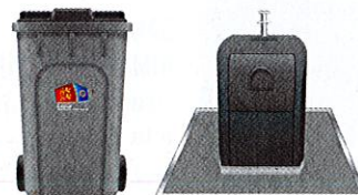
Bac à Ordures Ménagères (OM)