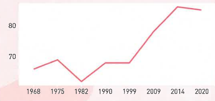
Evolution de la population de 1968 à 2020