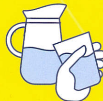
BUVEZ DE L'EAU