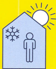
RESTEZ AU FRAIS