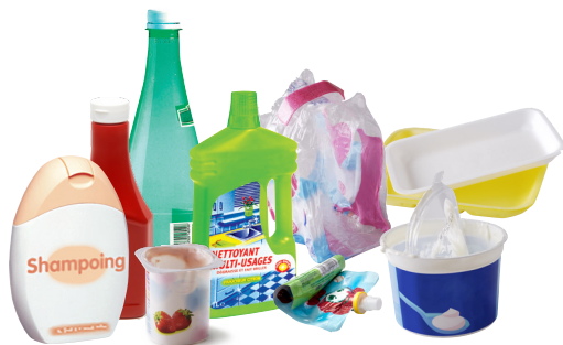
Emballages en plastique