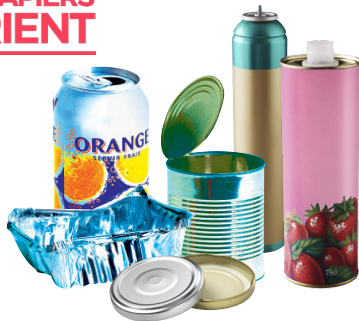
Emballages en métal

TOUS LES EMBALLAGES ET LES PAPIERS SE TRIENT