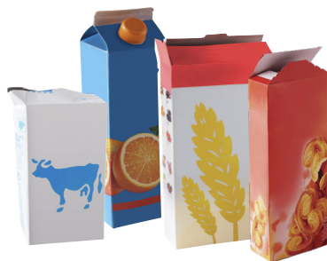
Briques alimentaires et emballages cartonnettes