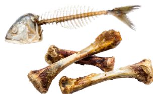
Déchets alimentaires non compostables