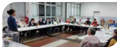
Soirée vote du comité de lecture Adultes 2023