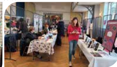
Le salon s'installe

Diverses activités ont été proposées, telles que :