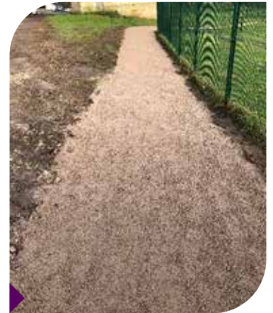
Voie d'accès au parcours santé