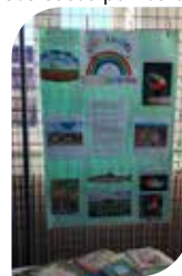
Le panneau « les couleurs de l'arc en ciel » réalisé par la bibliothèque de Cauvigny

Environ 175 personnes ont arpenté les allées du salon et ont fait l'acquisition de livres présentés et dédiés par leurs auteurs