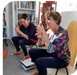
Jeux de doigts