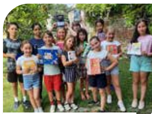
Les jeunes participants de Cauvigny.

Le mercredi 21 juin à la bibliothèque, chaque jeune lecteur a donné son avis sur les livres sélectionnés. Un goûter a clôturé cet après-midi. La bibliothèque a offert un livre à chaque participant ainsi qu'un marque-pages à son nom.