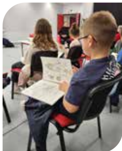
A la découverte d'un cahier de croquis de l'auteur.