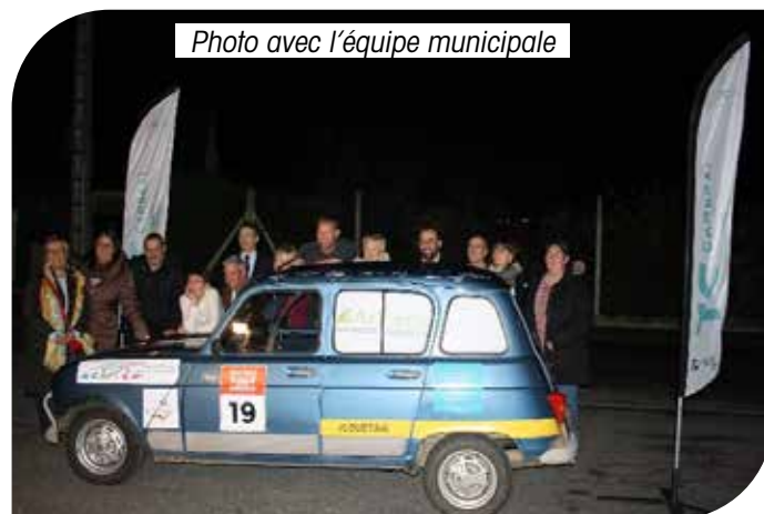
Photo avec l'équipe municipale