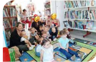
Tous très attentifs .....

Été en roue livre à la bibliothèque avec les enfants de la M.A.M. et leurs « nounous » le jeudi 6 juillet