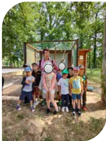
Sortie de fin d'année des classes maternelle au parc St Léger 3 juillet 2023