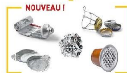
Tous les emballages en métal