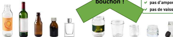
Tous les emballages en verre : bouteilles, pots, bocaux et flacons