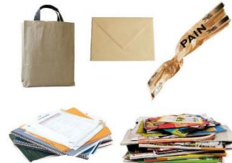
Tous les papiers

INTERDIT : Papier déchiqueté ou passé au destructeur, mouchoir et essuie tout