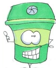
conteneur à verre

Un doute ? Téléchargez le Guide du Tri !