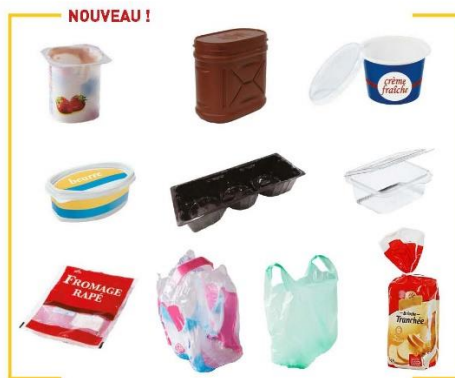
Tous les emballages en plastique