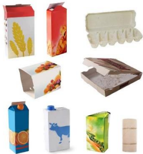
Tous les cartons, cartonnettes et briques alimentaires