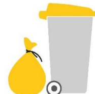
bac ou sac jaune