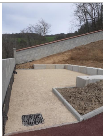
Jardin du souvenir