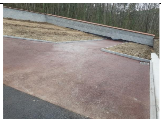
Espace futures concessions

Le portail sera fourni et posé par l'entreprise DENJEAN de Saint Martin en Haut pour un coût de 3 649 € ht.