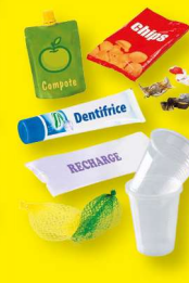
Autres emballages en plastique