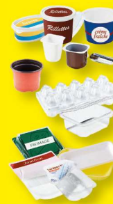
Pots, boîtes et barquettes en plastique