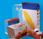
Petits emballages en carton