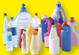
Bouteilles, flacons et bidons en plastique