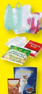
Sacs, sachets et films en plastique