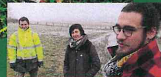
24, rue de la forge - 18360 Saint-Vitte Fb : Terre des Apprentis'sages

Espaces d'animation et de transformation des pratiques culturelles et pédagogiques. Tout un projet en cours de construction pour accompagner le développement et les apprentissages, en respectant les rythmes et les élans de vie de chacun.