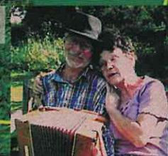
73, lieu dit Les caves 18170 Ardenais

6000 m 2 d'espace paysager de 40 ans d'âge. Un lieu créatif et agréable tourné vers la préservation de la biodiversité, adapté à l'évolution du climat, cultivé sans désherbants, engrais ou pesticides chimiques. Un lieu culturel conçu dans un esprit d'accueil et de convivialité.