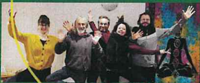
Les Rogères 18170 Rezay www.larbredananda.fr Fb : l'Arbre d'Ananda

Stages, séjours, conférences... pour être totalement écolo ! Aussi bien dehors (permaculture, forêt nourricière et sauvage...) que dedans (bien-être du corps et de la psyché, éducation, échanges...)