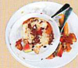
Restes de repas (pâtes, riz, légumes...)