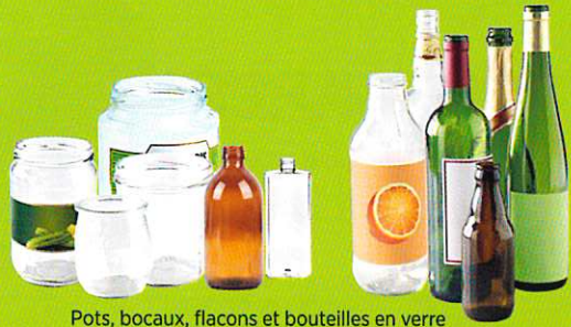
Pots, bocaux, flacons et bouteilles en verre

SANS BOUCHON NI COUVERCLE EN VRAC ET BIEN VIDÉS