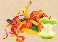
Pelures de fruits et épluchures de légumes