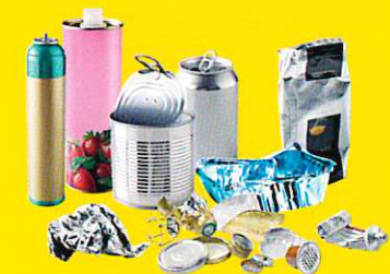
Emballages métalliques y compris les petits