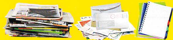
Journaux, magazines, publicités, enveloppes, courriers, cahiers...

JE N'EMBOÎTE PAS LES EMBALLAGES, JE LES DÉPOSE EN VRAC ET BIEN VIDÉS.