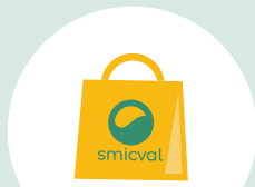
Un sac pour vos emballages