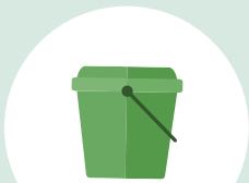
Un bioseau pour les restes alimentaires

À cette occasion, nos conseillers vous expliqueront le fonctionnement de ce nouveau système qui remplacera la collecte de vos déchets en porte à porte et vous remettront également vos équipements.