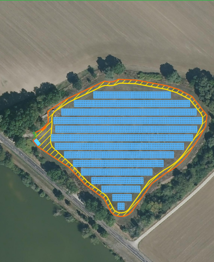
Plan de masse de l'installation