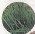
Tontes de pelouse et feuilles mortes (petites quantités)*