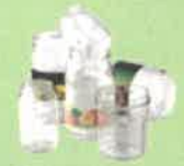
Pots et bocaux