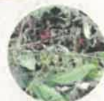
Petits branchages broyés*