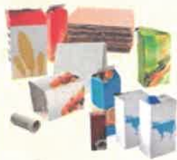
Emballages en papier et carton

Bouteilles, flacons en plastique, barquettes, boîtes, films, filets, sacs, sachets, pots, tubes