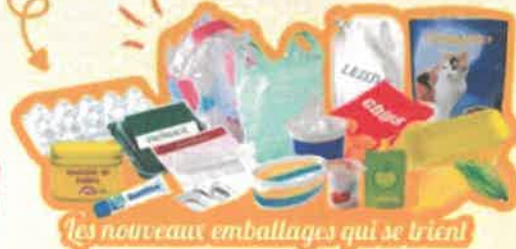
Les nouveaux emballages qui se trient