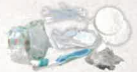
Couches culottes, lingettes et articles d'hygiène souillés