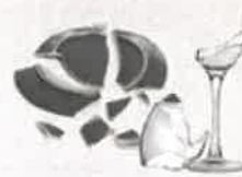
Petite quantité de vaisselle cassée (verre, porcelaine...)