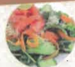
Épluchures (fruits et légumes), restes de repas d'origine végétale