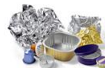
Capsules café, Bougies chauffe-plat, Barquettes, Boîtes et Feuilles