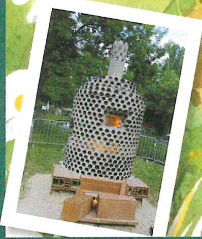
Création de Frédérique LEGER