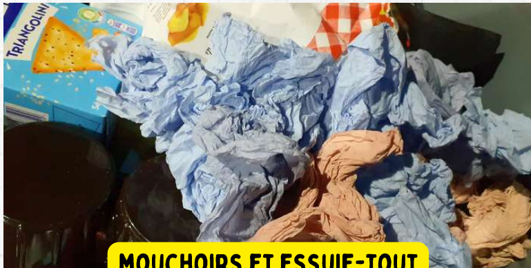
MOUCHOIRS ET ESSUIE-TOUT