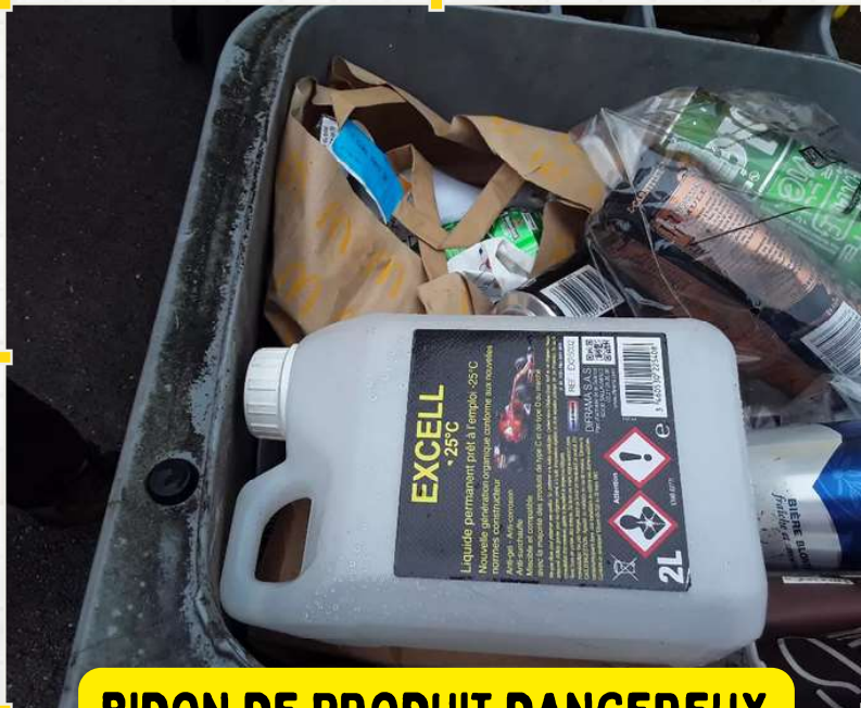
BIDON DE PRODUIT DANGEREUX

MERCI DE DÉPOSER VOS BIDONS DE PRODUITS DANGEREUX EN DÉCHETTERIE.