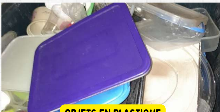
OBJETS EN PLASTIQUE