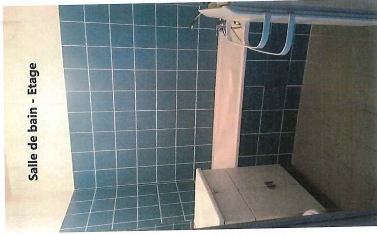
Salle de bain - Etage