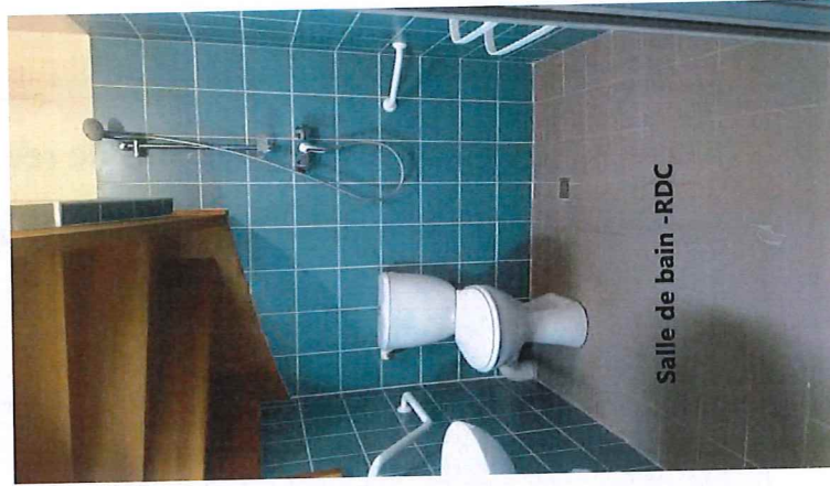
Salle de bain - RDC