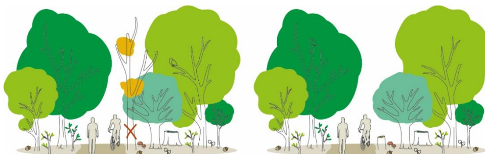
Les arbres dépérissants et dangereux aux abords des chemins, des routes et dans la parcelle sont coupés pour assurer la sécurité de tous.

La forêt domaniale de la Commanderie est gérée par les équipes de l'Office national des forêts. La sécurité des usagers de la forêt relève de l'ONF. A ce titre, la commune de Larchant a sollicité l'ONF pour intervenir dans une zone où les arbres dépérissent.