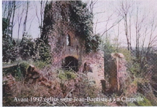
Avant 1997 église saint Jean-Baptiste à La Chapelle