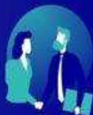
entreprises et commerces