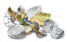
Bouchons, Capsules, Couverts, Opercules, Collierettes et Couronnes