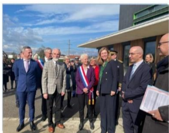
La Présidente de l'Assemblée Nationale au Collège Alice Mosnier de Fortschwihr le jeudi 21 mars 2024

Le jeudi 21 mars, Fortschwihr a accueilli la 4 ème Personnalité de l'État Français : Mme Yaël BRAUN-PIVET, Présidente de L'Assemblée Nationale.