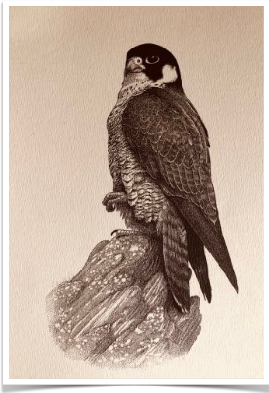
Dessin du faucon pèlerin à la plume de Pierre Déom ( Revue La Hulotte )