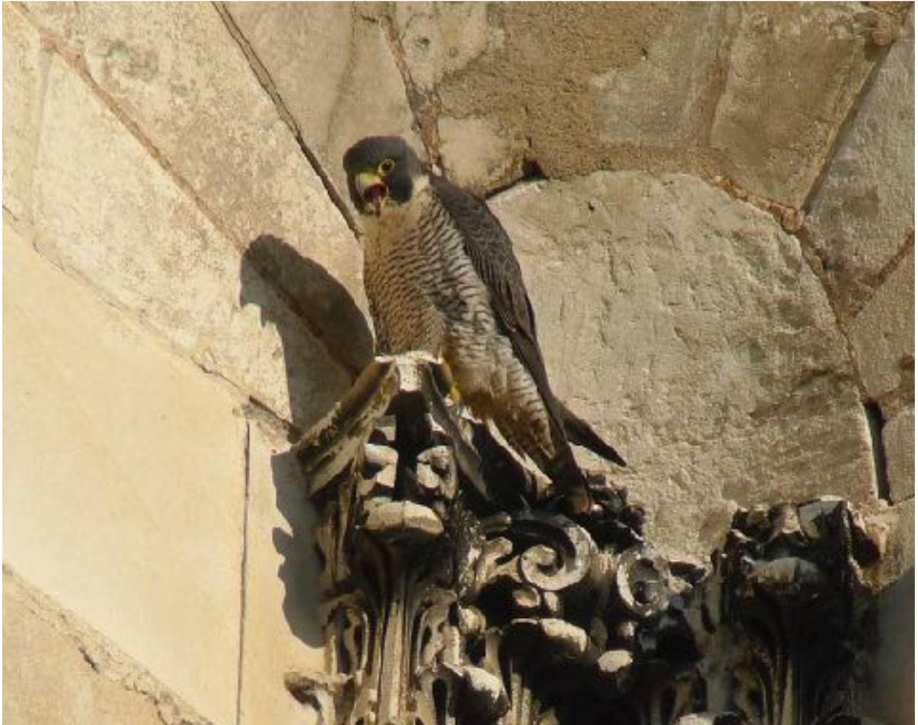
Aux alentours de la Cathédrale de Troyes, le faucon pèlerin se familiarise avec les lieux