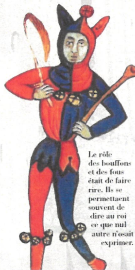
Le rôle des bouffons et des fous était de faire rire. Ils se permettaient souvent de dire au roi ce que nul autre n'osait exprimer.