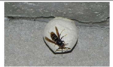
Un seul insecte vole autour du nid ou est dans le nid (= la reine) : intervenez vous-même sans danger.

et sans risque le nid primaire à son stade précoce