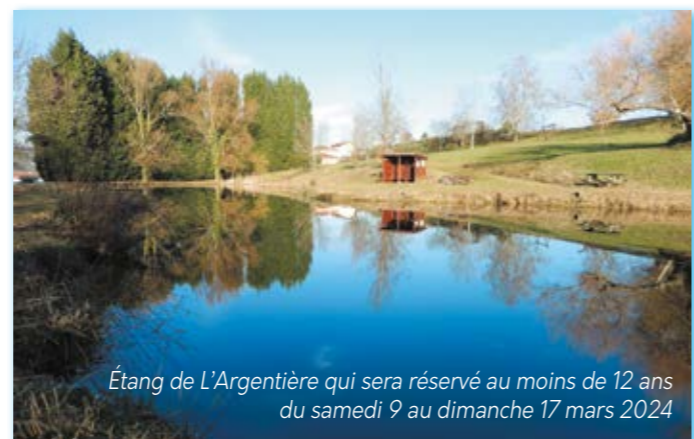
Étang de L'Argentière qui sera réservé au moins de 12 ans du samedi 9 au dimanche 17 mars 2024