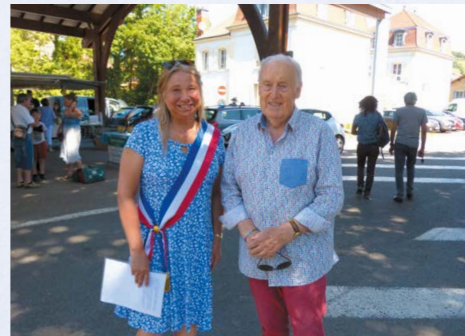
20 ans du marché bio 11 juin 2022