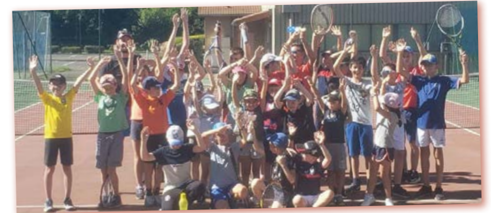
École de tennis

Le Tennis Club remercie Madame la Maire et son conseil municipal pour leur engagement et leur écoute.