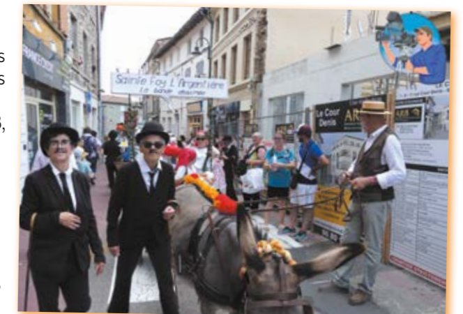
Comice 2023 à St-Laurent, le char de Ste-Foy-l'Argentière

Association Vidéo vous propose de faire des diaporamas de vos photos et diapositives ainsi que des montages de vos films souvenirs de voyage sur clé USB, disque dur, DVD. Nous sommes équipés pour transformer vos K7, VHS, Hi 8-Super8, Mini DV, en MP4 et pour filmer tous vos événements. Supports clé USB, disque dur, DVD. Contactez-nous au 06 11 25 39 24. associationvideo@gmail.com