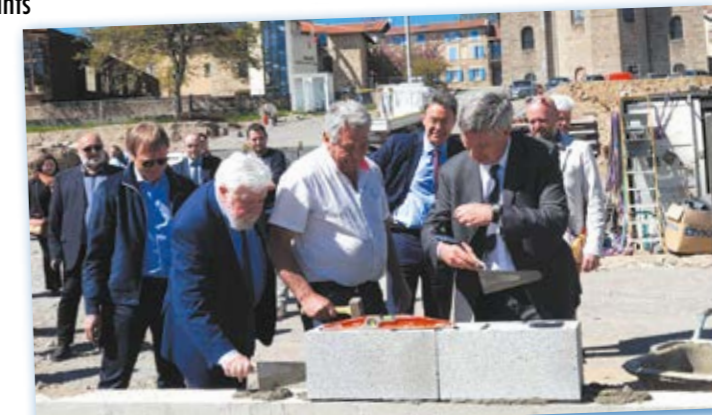
Pose de la 1 re pierre

Ce sera un domicile privé avec pour objectif de s'inclure dans la vie du village.