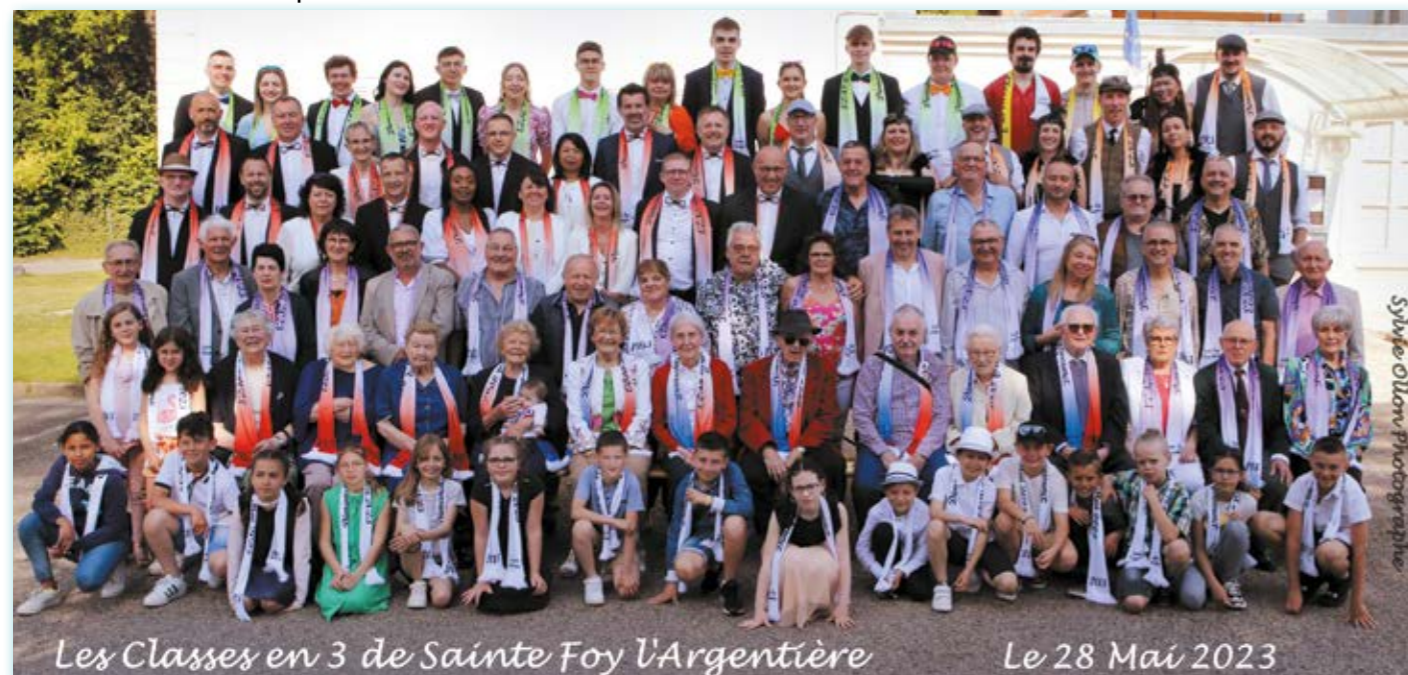
Les Classes en 3 de Sainte Foy l'Argentière

Merci pour toute cette organisation assurée par notre Président, les membres du Bureau et un noyau solide de conscrits et conscrites... Rendez-vous pour la demi-décade.