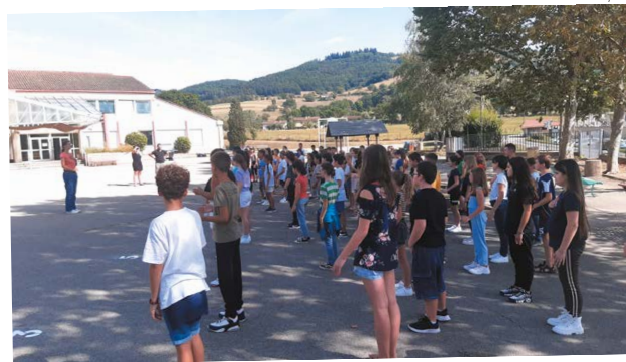
Rentrée en musique