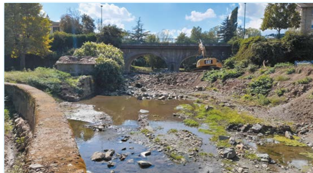
Travaux pont de La Giraudière

Ce chantier d'ampleur a fait l'objet de plusieurs visites en cours de chantier pour les habitants et écoliers de La Giraudière.