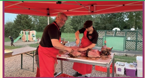
Découpe de la cuisse de Boeuf

Cuivres en Dombes était au Cœur de village le samedi 15 Juillet avec le Skokiaan Brass Band qui nous régalaient de Jazz, de funk et de rythmes afro-caribéens