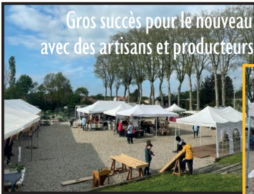
Gros succès pour le nouveau marché traditionnel du 1er Mai avec des artisans et producteurs