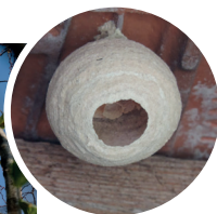
Nid secondaire (40 cm à 1 m) situé principalement en hauteur.