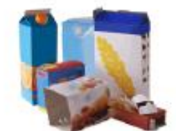
Emballages et briques en carton