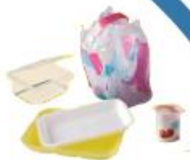
Autres emballages plastique