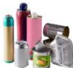
Emballages en métal