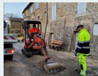
Réparation d'une rupture de canalisation le samedi 23/12, veille de réveillon de Noël.