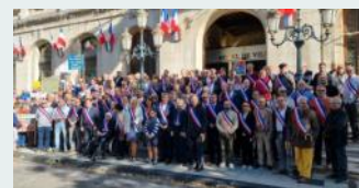
Rassemblement des Maires de la Drôme et de l'Ardèche