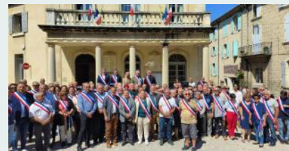
Rassemblement des Maires à Grignan