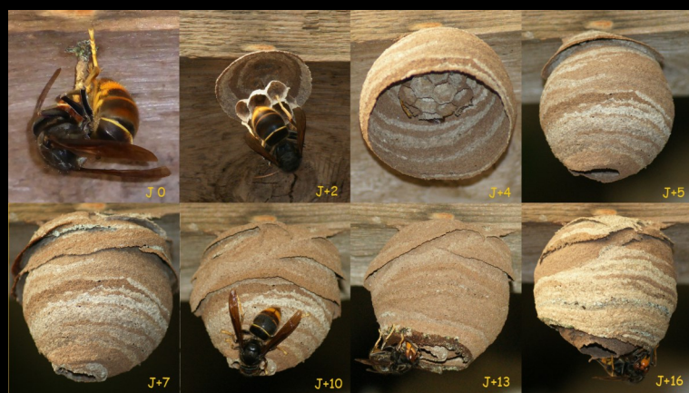
NIDS PRIMAIRES (faciles à détruire)

Le piégeage préventif n'est pas recommandé (risque pour autres insectes) et est réservé aux apiculteurs.