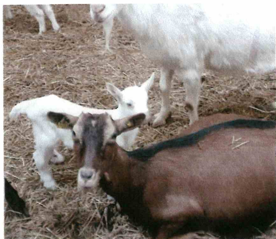
Séverine à AMBIERLE