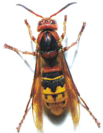
Frelon commun (jusqu'à 4 cm)