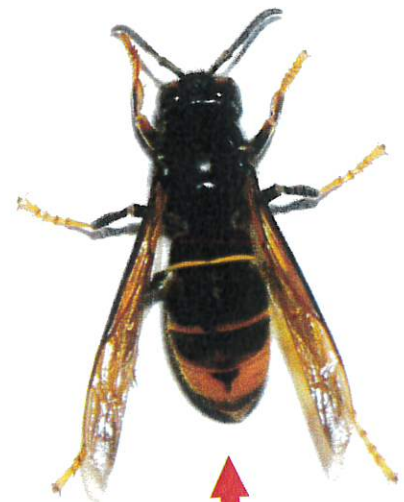
Frelon asiatique (taille réelle 3 cm)