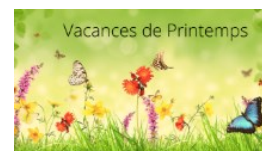
Vacances de Printemps

Collecte des ordures ménagères Conseil municipal à 19h00 à la salle polyvalente Journée éco citoyenne—RDV à 13h30 devant la mairie -Marché mensuel le matin avec chasse aux œufs à 11h00 -Vide ta chambre de 7h à 17h organisé par les parents d'élèves Cinéma à la salle polyvalente à 20h30 Collecte des ordures ménagères -PIMMS Mobile sur le parking du monument aux morts de 9h30 à 11h30 -Conseil Communautaire à 18h00 à RAZES -Début des vacances scolaires -Repas organisé par le Foot Thé dansant organisé par le Comité des Fêtes