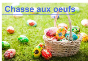
Chasse aux œufs

Quand le foyer Lino Vartan doit fermer pour raisons sanitaires, Milann n'a pas d'autre choix que de répondre à l'invitation d'une maison de retraite dans le Sud qui les accueille pour l'été. Tous embarquent dans le bus d'Alban. Enfants et anciens découvrent alors le Bel Azur Club, une villa idyllique au bord de la mer : le rêve ! Une aubaine pour ces gamins orphelins qui n'ont jamais eu de vacances... Mais le paradis tourne à l'enfer car anciens et nouveaux pensionnaires du 3 ème âge se détestent ! La guerre des seniors est déclarée !