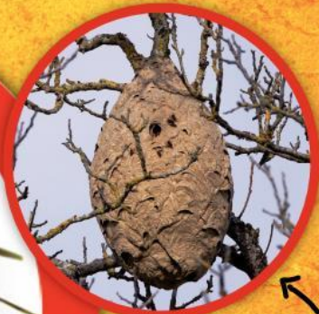
Nid de frelon asiatique